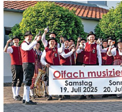
Die Musikvereinigung seit 1805 e.V. in Münsterhausen