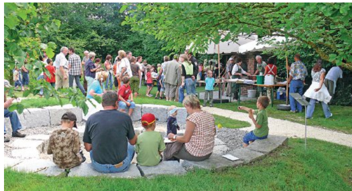
Der Gartentag im Kreislehrgarten ist informativ und unterhaltsam.

Scheren- und Messerschleifer seine Dienstleistung an. Zwischendurch können sich die Besucherinnen und Besucher bei Weißwurst, Pizza, Brotzeit, Kaffee und Kuchen oder einem Eis stärken. Kooperationspartner der Aktion sind das Amt für Ernährung, Landwirtschaft und Forsten Krumbach, der LBV mit seiner Kreisgruppe Günzburg und der Imkerverein Krumbach. Weitere Informationen gibt es unter www.gartenbauvereine-kreis-gz.de