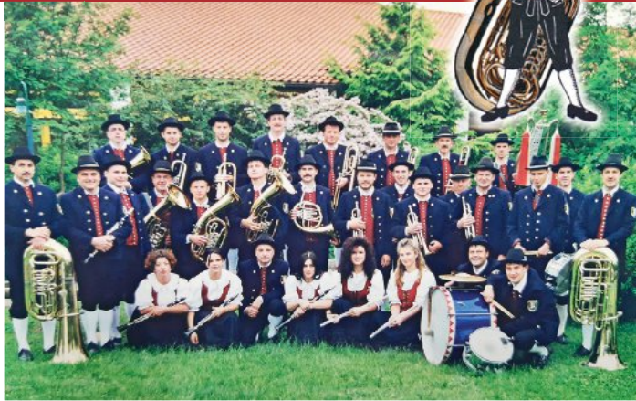
Ein Bild aus vergangenen Tagen: Die Musikvereinigung Münsterhausen