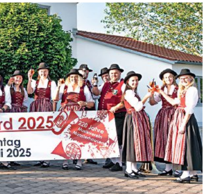
Münsterhausen feiert das 220-jährige Bestehen