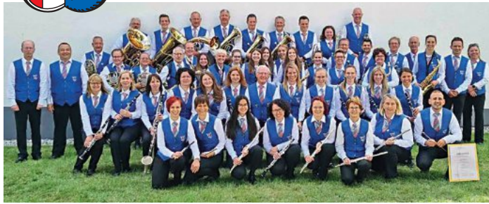
Der Musikverein aus Lautern startet am Samstagabend mit stimmungsvoller Unterhaltung