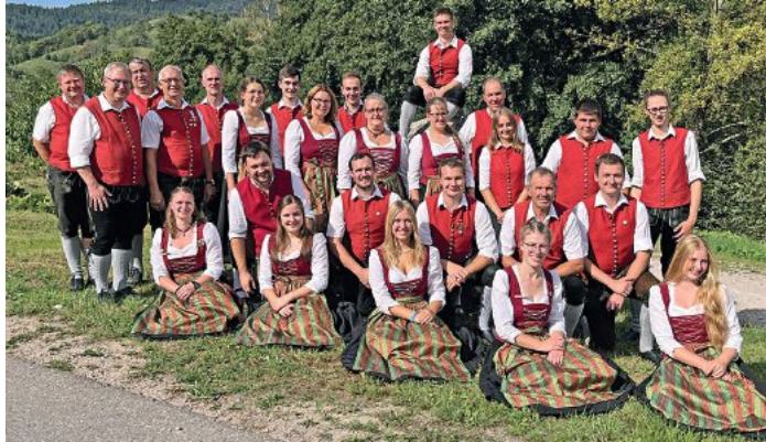
Der Musikverein Behlingen-Ried spielt am Sonntag zum Mittagstisch.