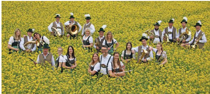
Der Musikverein Billenhausen unterhält am Sonntag zum Festausklang