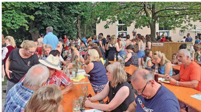
Die „Stammbar“ lädt viele Besucher auf ein kühles Getränk ein

dem das Mindelstechen dann vom unparteiischen Schiedsrichter abgepfiffen ist, unterhält zuerst eine kleine Besetzung mit dem Namen ZHVB (Zwei Händ voll Blech) die Festgäste, ehe ab 20 Uhr die Musikerinnen und Musikern aus Oberrohr zu ihren Instrumenten greifen. Später wird auch die Siegerehrung des Mindelstechens stattfinden.