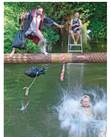
Auch das Outfit wird prämiert

Nach dem Auftakt des Mindel Open Air durch das Mindelstechen, spielt das Blasorchester Kötz für die Besucher. Nach-