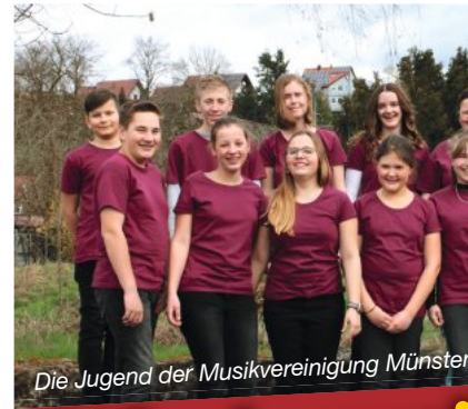
Die Jugend der Musikvereinigung Münsterhausen