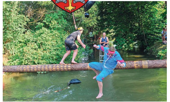
Gleich wird Einer patschnass – das Mindelstechen sorgt für „a mords Gaudi“

Das Mindelstechen wird um 17.30 Uhr angepöflet und wieder in bewährter Form durchgeführt. Bei diesem Wettstreit kämpfen verschiedene, amüsant maskierte Teams um den Pokalsieg. Jeweils ein Mitglied jedes Teams steht sich dann auf einem über die Mindel gelegten Baumstamm gegenüber, der bis vor Kurzem noch als Maibaum gedient hat. Dann heißt es „Auge um Auge, Zahn um Zahn“. Jeder versucht,