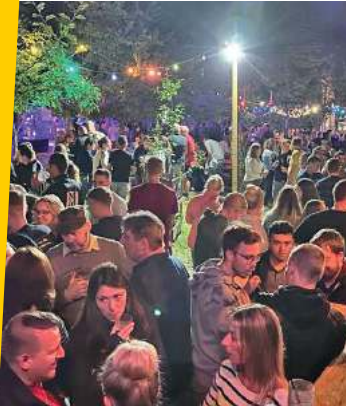
Partytime am Donnerstag und Freitag