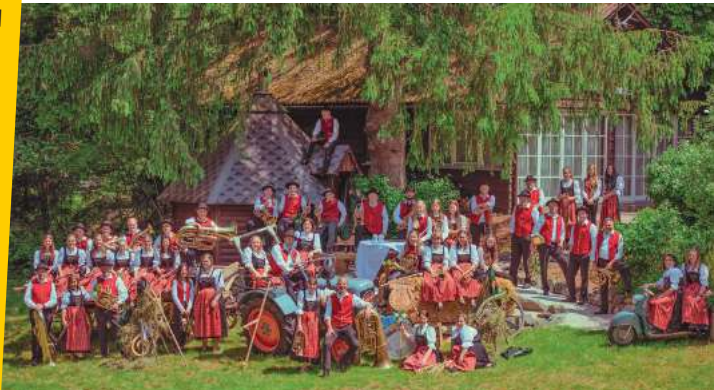
Der MV Memmenhausen sorgt am Samstagabend für beste Stimmung