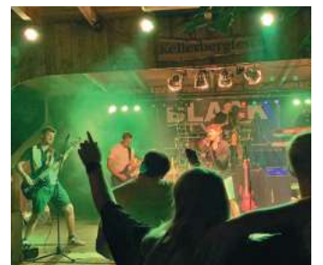
Die Band Black Type rockt am Donnerstag den Kellerberg