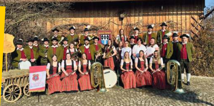
Der Musikverein Haselbach spielt beim Frühschoppen am Sonntag