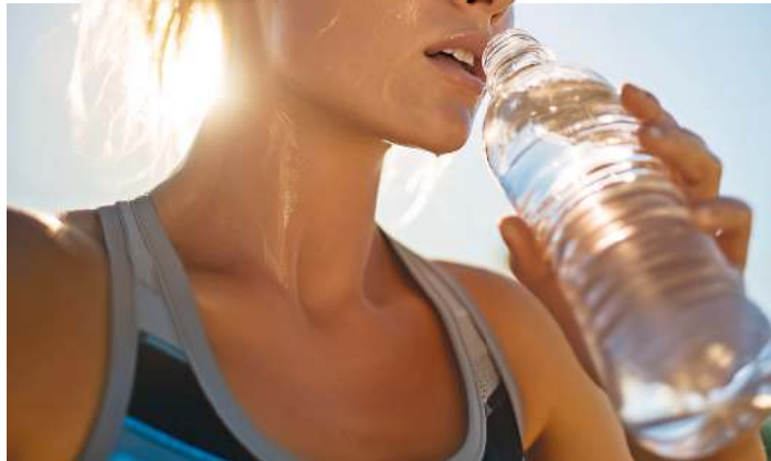
Ausreichendes Trinken ist bei hohen Temperaturen besonders wichtig.

Die Hitzewelle Ende Juni hat nach der Einschätzung von Wissenschaftlern zu deutlich mehr hitzebedingter Todesfälle geführt. Das geht aus der Studie des Imperial College London und der London School of Hygiene und Tropical Medicine hervor, die vom Klimanetzwerk GSCC in Brüssel veröffentlicht wurde. Sie schätzt die Zahl der hitzebedingten Todesfälle in zwölf europäischen Großstädten während eines Zehn-Tage-Zeitraums von Ende Juni bis Anfang Juli auf insgesamt 2.300. Etwa zwei Drittel davon, rund 1.500, sind demnach den höheren Temperaturen durch die Klimaerwärmung zuzuschreiben. Ohne den Klimawandel hätte es sie nicht gegeben, heißt es in der Studie. Der Studie zufolge erwärmte sich die Temperatur in zwölf Großstädten, darunter Frankfurt am Main, Paris, London und Madrid, durch den Klimawandel um ein bis vier Grad zusätzlich. Ohne diese Erwärmung wären den Berechnungen zufolge in diesen Städten etwa nur 800 Menschen an Hitze gestorben. Allein in Mailand starben an den heißen Tagen Ende Juni 499 mehr Menschen als gewöhnlich, in Paris waren es 373, in Barcelona 340. „Für Tausende von Menschen