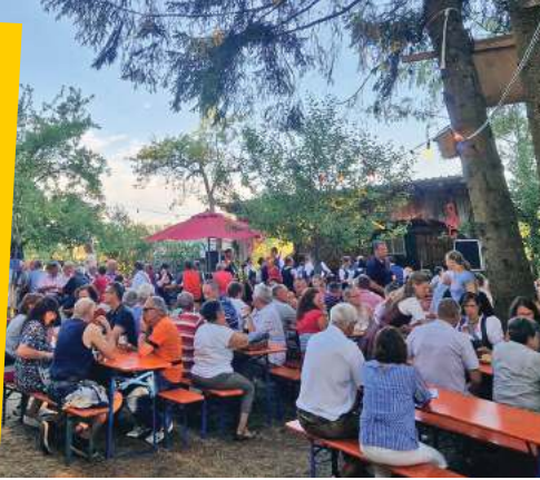
Gemütliche Stimmung auf dem Kellerberg

Die heilige Messe wird am Sonntag, den 20. Juli um 10.15 Uhr wieder auf dem Kellerberg gefeiert. Im Anschluss daran lädt der Musikverein Balzhausen zum Mittagstisch ein, bei dem der Musikverein Haselbach für gesellige Stimmung sorgt. Ab 14 Uhr findet bei Kaffee und Kuchen der Familiennachmittag mit Kinderschminken, Spielen und einer Hüpfburg statt. Dabei unterhält die Jugendkapelle Mindel-Zusam die Gäste. Der Musikverein Balzhausen freut sich auf zahlreiche Besucher. Bei schlechter Witterung wird die Veranstaltung um eine Woche verschoben und findet dann vom 24. bis 27. Juli statt.