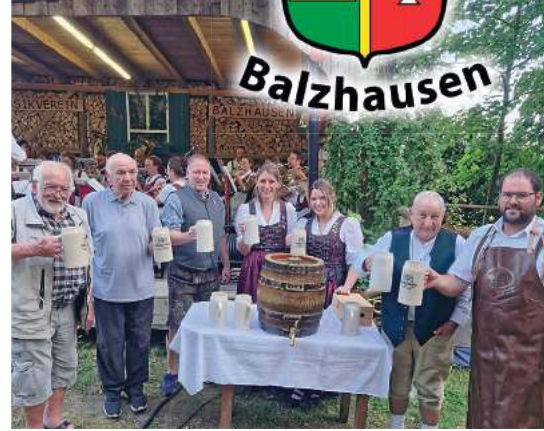
Der Bieranstich am Samstag des vergangenen Jahres