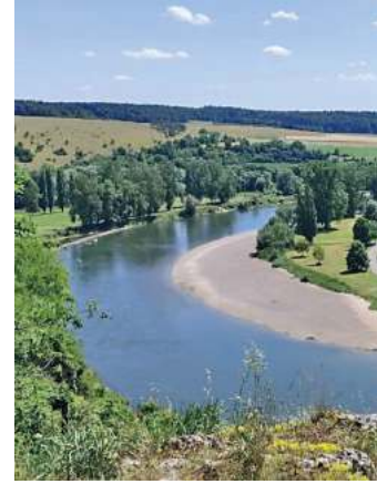
Blick auf die wasserarme Donau

Münsterhausen. Am Dienstag, den 24. Juni startete das Senioren-Team Münsterhausen mit 47 Teilnehmern in Richtung Altmühltal. Zuerst ging es mit dem Bus nach Riedenburg zum Mittagessen. Die geplante Schifffahrt von Kelheim zum Kloster Weltenburg fiel leider wegen Wassermangel in der Donau aus. Diese Programmänderung sorgte kurz für Enttäuschung.