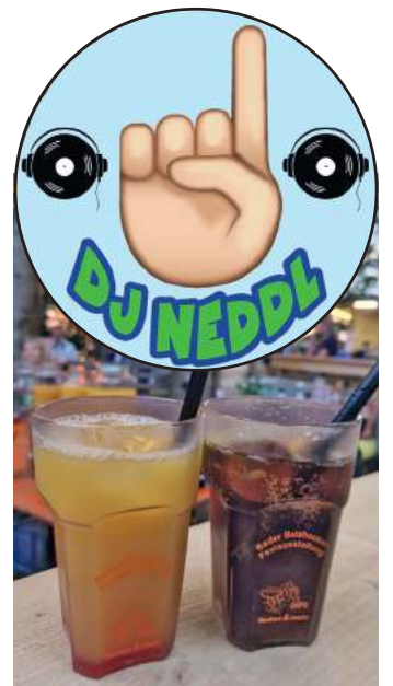
Die Malle-Party steigt am Samstag