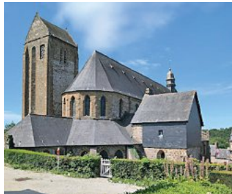
Die Orgel in der Kirche St. Évroult in Mortain muss restauriert werden. Dafür werden beim Stadtfest Thannhausen Crêpes verkauft.

Zum Stadtfest kommen Gäste aus der Normandie