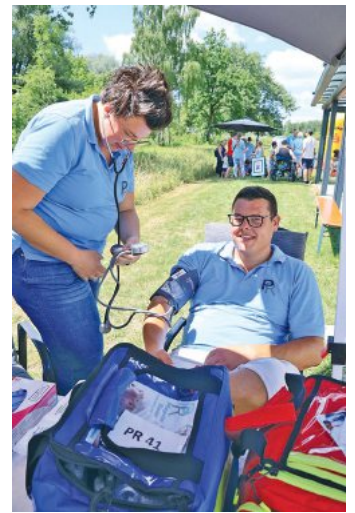
Am Tag der offenen Tür konnte man auch den Blutdruck messen lassen.

Bei einem Vortrag über die ambulanten Pflegeleistungen und die Tagespflegeleistungen sowie ihre Finanzierung konnten sich interessierte Besucher an diesem Tag vor Ort informieren.