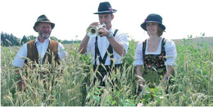
Ökologischer Landbau in Aichen: Hier spielt die Musik