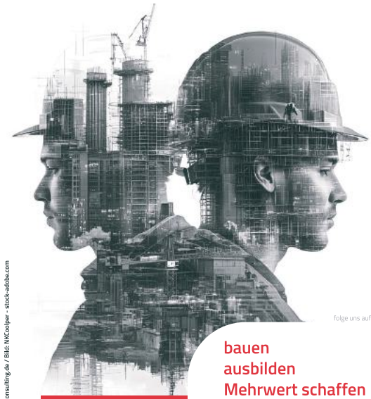
Gestaltung: www.livestock.computing.de

stellt dieser Weg eine ideale Kombination dar. Denn nach dem Abschluss beider Prüfungen besitzt der Absolvent neben dem theoretischen, eben auch das fast noch höher einzuschätzende Praxiswissen.