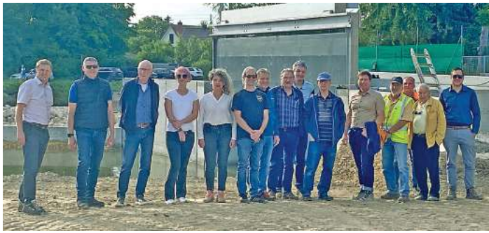
Die Bauarbeiten am Thannhauser Teilungswehr sind noch im Gange.