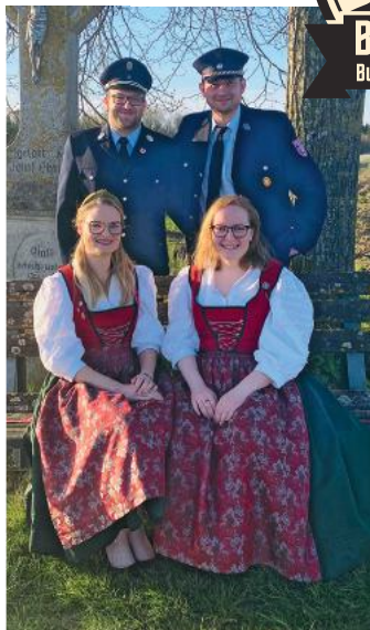
Burger Dorffest Burger Bergschützen & FFW Burg