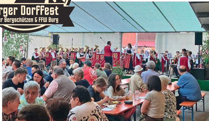
Der Musikverein Memmenhausen sorgte auch im letzten Jahr für Stimmung