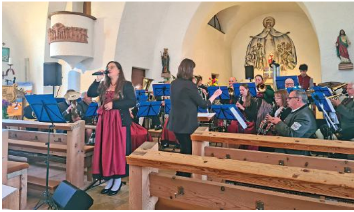
Gesang und Blasmusik überzeugten: Bei ihrem Frühjahrskonzert heimste die Musikkapelle Freihalden-Oberwaldbach stehende Ovationen des Publikums ein.