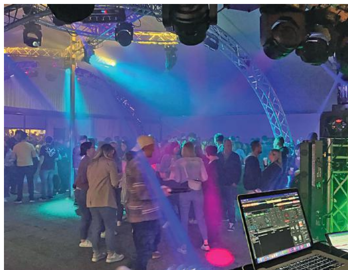
Am Freitag-Abend steht die Party mit „Black Type“ auf de Programm