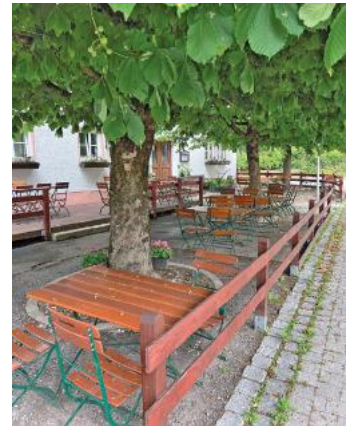
Bei schönem Wetter ist auch der Biergarten geöffnet

Durch ein breites Angebot an regionalen und internationalen Gerichten findet jeder auf der Speisekarte für seinen Geschmack das Richtige. Neben leckerer Pasta, knusprigen Pizzen, Burger, Fingerfood und Schnitzel, Steaks, Fischgerichten, Geflügel sowie einer Auswahl an feinen Salaten bietet das Lokal auch besondere Spezialitäten aus der türkischen Küche an. Auf Wunsch können alle Speisen auch abgeholt oder nach Hause geliefert werden. Der Pflugwirt hat täglich ohne Ruhetag von 11 bis 23 Uhr geöffnet. Deshalb bietet es sich sogar an, die Mittagspause dort in angenehmer Atmosphäre zu genießen. Bei entsprechendem