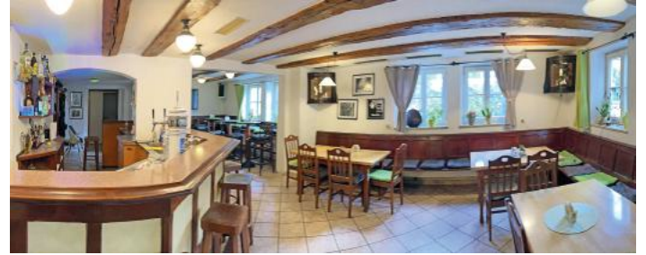
Der Gastraum des „Pflugwirt“ mit seiner besonderen Atmosphäre

Thannhausen. Anfang März hat im traditionsreichen Lokal „Zum Pflugwirt“ die Leitung gewechselt. Die neuen Pächter freuen sich schon auf die Stammgäste und wollen mit kulinarischer Vielfalt und professioneller Gastlichkeit überzeugen. Qualität ist in der Küche der oberste Maßstab und so werden frische Zutaten mit viel Liebe zu genussvollen Speisen zubereitet.