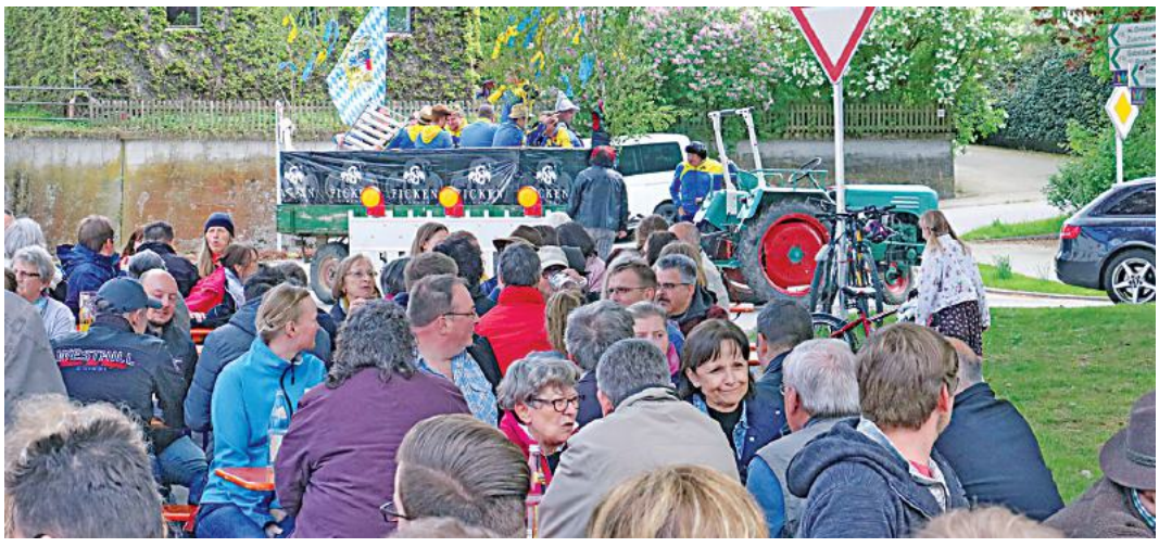
Die Freihaldener Vereine laden am 1. Mai wieder zum Maibaumfest

Freihalden. Auch heuer laden die Freihaldener Vereine wieder zur stimmungsvollen Maibaumfeier auf ihren schönen Dorfplatz ein. Nachdem der prächtig geschnitzte Maibaum bereits am Samstag, den 26. April, ab ca. 16 Uhr aufgestellt wird, kann er danach schon von allen bewundert werden. Maibaumfest am 1. Mai Perfekt vorbereitet freut sich der ganze Ort auf das traditionelle Maibaumfest. Denn wer die örtlichen Vereine kennt, weiß, dass beim freudigen Miteinander auch die kulinarischen Genüsse nicht zu kurz kommen. Bereits zum Start des geselligen Festes am Maifeiertag um 11 Uhr dürfen sich neben den Einheimischen gerne auch gutgelaunte Auswärtige auf den Bierzeltgarnituren niederlassen. Richtig eng wird es dann wohl gegen Mittag werden wenn ab 11.30 Uhr neben Grillwürsten, Schaschlik und