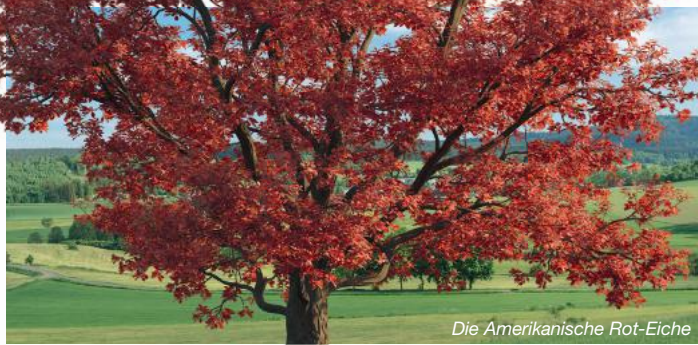
Die Amerikanische Rot-Eiche

Der Tag des Baumes wird jedes Jahr am 25. April begangen und soll die Bedeutung des Waldes für den Menschen und die Wirtschaft im Bewusstsein halten. Der Tag des Baumes geht auf Aktivitäten des amerikanischen Journalisten Julius Sterling Morton zurück, der 1872 einen „Arbor Day-Resolution“-Antrag an die Regierung von Nebraska stellte. Sein damaliges Ansinnen war, den damals sehr baumarmen Bundesstaat durch eine jährliche Bepflanzungsaktion aufzuforsten. Die Aktion war ein großer Erfolg, denn am 10. April 1872 pflanzten Bürger und Farmer in Nebraska mehr als eine Million Bäume. An diesem Tag werden immer noch traditionell Baumpflanzungen durchgeführt. Der Tag des Baumes wurde am 27. November 1951 von den Vereinten Nationen beschlossen. Der deutsche „Tag des Baumes“ wurde erstmals am 25. April 1952 begangen. Neben der wichtigen Funktion der Bäume bei der Gestaltung von Kulturlandschaften begleitet vor allem die Holznutzung die Entwicklung der Menschheit. Holz ist ein vielseitiger Bau- und Werkstoff, dessen produzierte Menge die Produktionsmengen von Stahl, Aluminium und Beton weit übersteigt. Bäume sind für den Klimaschutz und das Wohlbefinden des Menschen wichtig. Sie spenden