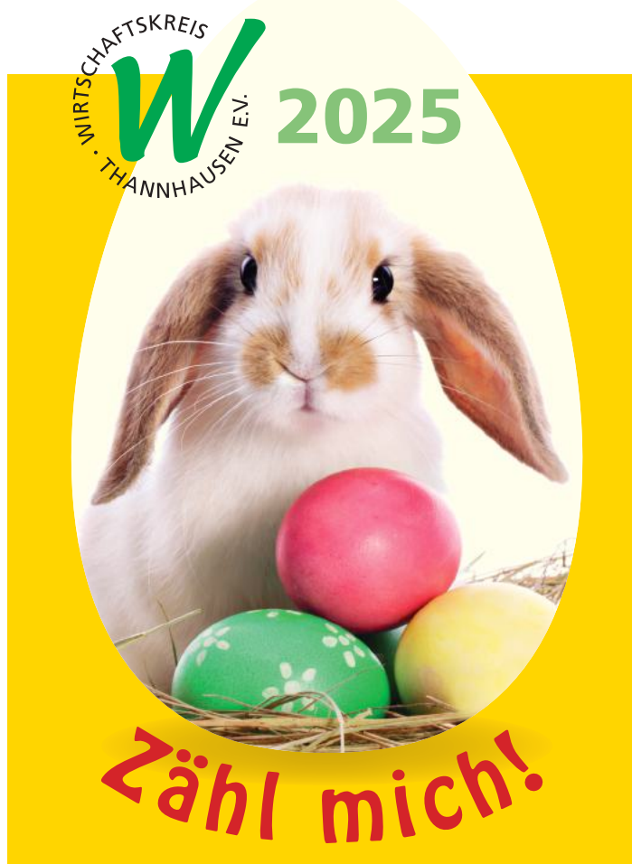
Diese Osterhasen gilt es in den Thannhauser Geschäften zu suchen.