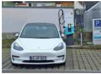
Der neue Ladestandort in der Thannhauser Frühmeßstraße

Thannhausen. Zwei Schnellladepunkte der Firma Präg mit einer Ladeleistung von max. 50 kW stehen ab sofort in Thannhausen (Frühmeßstraße 14) für Elektroautos zur Verfügung. Die 1904 gegründete Präg-Gruppe ist ein Energie-Dienstleistungsunternehmen mit Hauptsitz in Kempten (Allgäu) und Verkaufsniederlassungen in Augsburg, Babenhausen, Leutkirch, Heidenau/Dresden, Leipzig und Weimar. Das Unternehmen berät Kunden in Energiefragen und deckt mit seinem Angebot an Energieträgern und Dienstleistungen fast alle Bereiche des täglichen Energiebedarfs ab: von Mobilität über Wärmeversorgung bis hin zur Lieferung, Speicherung und Eigenerzeugung von Strom. Das Familienunternehmen betreibt zudem ein Netz von 109 Tankstellen und zählt damit zu den größten mittelständischen Tankstellennetzbetreibern in Deutschland.