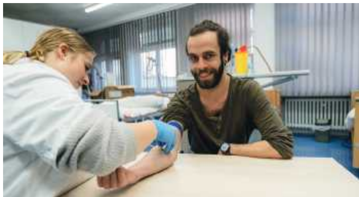
Praktische Übungen sind Teil der schulischen Ausbildung