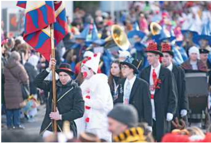
Faschnachtsverein Burkhardia e.V.