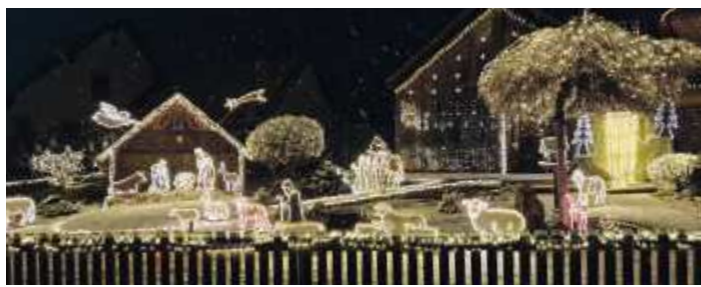
45.000 LED-Lichter beleuchteten den Garten in der Weihnachtszeit