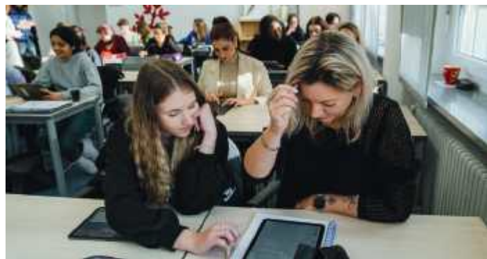
Die theoretischen Inhalte werden in einem modernen Lernumfeld vermittelt.