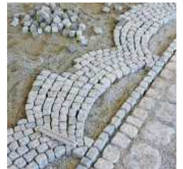
Pflastern von Segmentbögen

Am 16. Februar findet in der Turn- und Festhalle Jettingen wieder der traditionelle und sehr beliebte Kinderball des Faschingsvereins Burkhardia statt. Hier kommt keine Langeweile auf, denn DJ Michi wird auch in diesem Jahr wieder mit Faschingsmusik die Stimmung anheizen. Verschiedene Kinderspiele, ein Auftritt der m&m's aus Burgau und der Infinity-Cheer-Unit (VfR Jettingen) sowie das Luftballonregnen werden weitere Höhepunkte des Nachmittags sein. Einlass zum Kinderball ist am 16. Februar um 13 Uhr (Beginn 14 Uhr) für einen Beitrag von 3,00 Euro (Kind) und 3,50 Euro (Erwachsene).