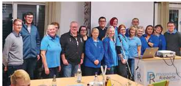
Die Geschäftsleitung des Pflegedienstes Riederle beim Informationsabend mit einem Teil der Mitarbeiter

am alten Holzherd gebacken. Da diese traditionelle Art des Backens Zeit erfordert, bitten wir um Verständnis, dass die Fasnachtsküchla nur vor Ort verzehrt werden können. Ein Verkauf zur Mitnahme ist leider nicht möglich. Der Eintritt beträgt 2,50 Euro.