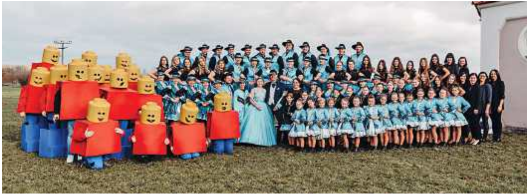
Der KC Ballustika im Jubiläumsjahr