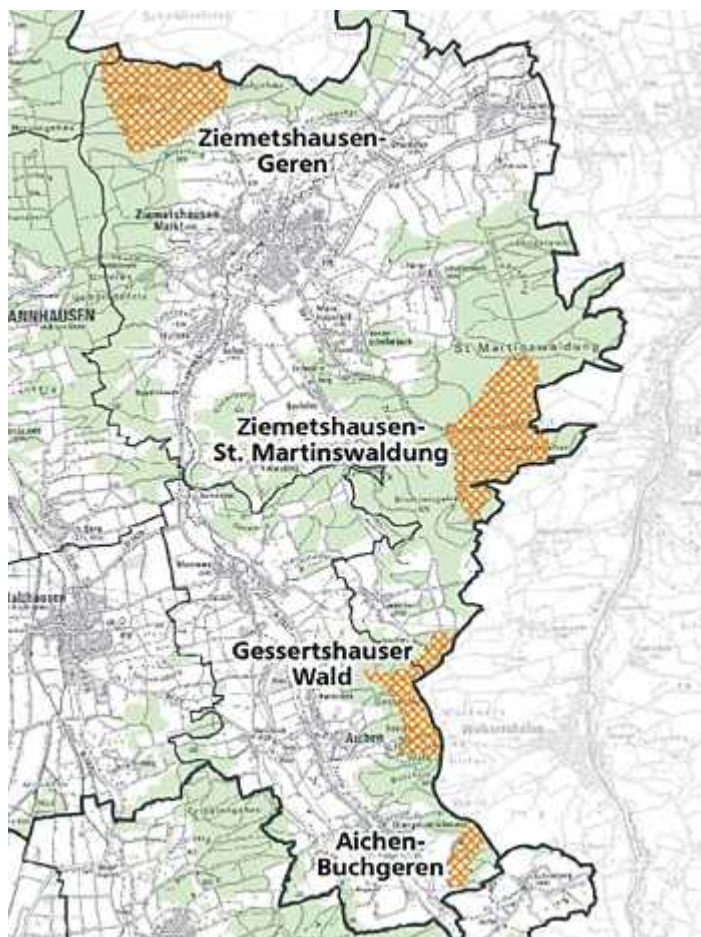
Die geplanten Vorrangflächen in den Gemeindegebieten von Ziemetshausen und Aichen

Die Marktgemeinde Ziemetshausen und die Gemeinde Aichen haben über das geplante Vorhaben weder durch den Vorhabensträger noch durch den