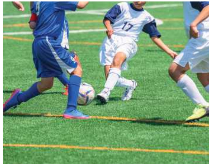
Auf dem Kunstrasen wird auch dieses Jahr wieder um jeden Zentimeter hart gefightet.

Fußball-Turnier auf Kunstrasen im Impuls Fitnesspark