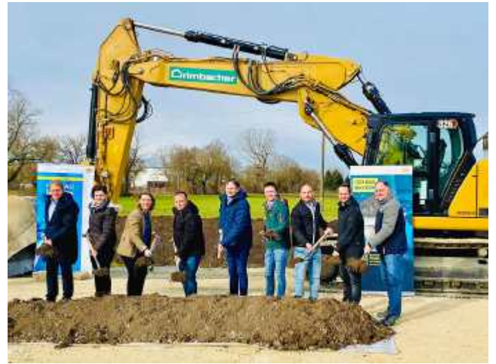
Die Bauarbeiten für den Ersatzneubau der Mindelbrücke in Jettingen haben begonnen.

Bei Verdacht auf Rattenbefall können Sie dies im Rathaus der Stadt Thannhausen unter Telefon 08281/901-9, spätestens am Vortag melden. Weitere Details sind aus der Bekanntmachung an den Anschlagtafeln zu entnehmen.